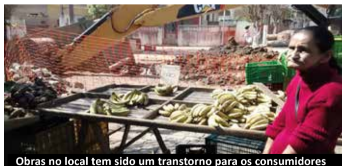
Obras no local tem sido um transtorno para os consumidores