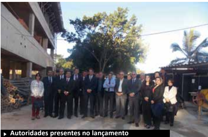
► Autoridades presentes no lançamento

Foi realizada nesta quinta-feira, 11 de agosto, a cerimônia de lançamento da pedra fundamental da nova sede das Promotorias de Justiça de São Lourenço, no Sul de Minas. Atualmente funcionando no Fórum da cidade, as instalações do MPMG passarão a ocupar um terreno de mais de mil metros quadrados, no centro da cidade. A previsão é que o prédio esteja pronto em janeiro do ano que vem.