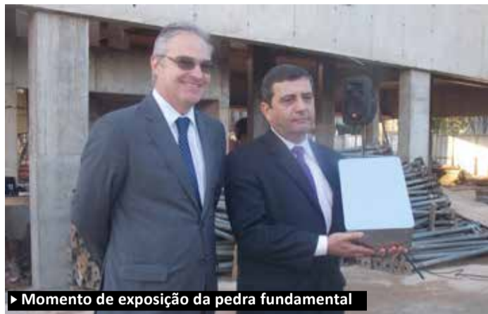
► Momento de exposição da pedra fundamental