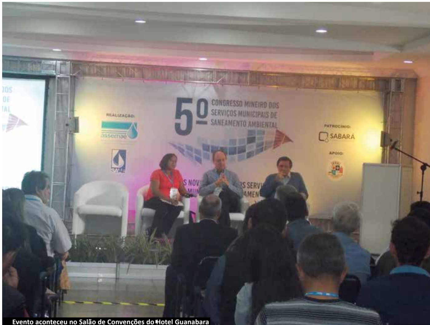
Evento aconteceu no Salão de Convenções do Hotel Guanabara

Considerado essencial para a promoção da saúde e qualidade de vida dos cidadãos, o saneamento básico foi o tema de maior destaque em São Lourenço entre dias 10 e 12 de agosto. Trata-se do 5º Congresso Mineiro dos Serviços Municipais de Saneamento Ambiental, que realizou palestras, painéis, oficinas, visita técnica à Estação de Tratamento de Água do município e feira de tecnologias para saneamento.